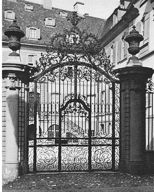
Portal des Blauen Hauses in Basel. Portail de la «Maison bleue», à Bâle.