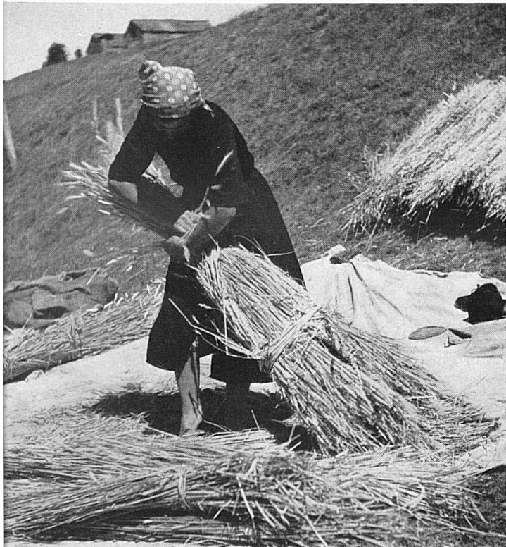
Bäuerin im Centovalli. Paysanne dans le Val Centovalli.

Durchsonntes Tessin! Du erwartest die Gäste des Herbstes. Sie werden dankbar in deinen warmen Mulden Kräfte für den Winter sammeln. Aus den zerkochten Gesichtern deiner Mütter werden sie aber auch von der Arbeit und Mühe lesen, die der Kampf mit dem Boden immer wieder bringt, die der erste Friedenssommer in besonders hartem Maße gebracht hat. Ks.