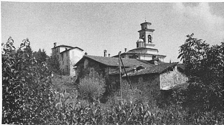
Oben: Magliaso im Malcantone. — Rechts: Alte Tessinerin. Lithographie von Max Truninger. — En haut: Magliaso dans le Malcantone. — A droite: Vieille Tessinoise. Lithographie de Max Truninger.