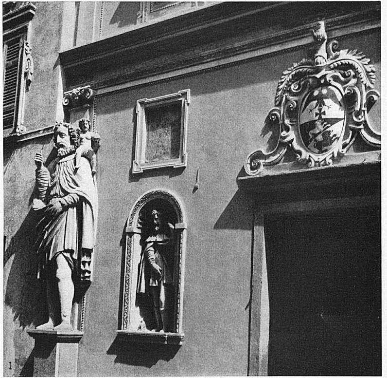
Christophorus-Skulptur in der Altstadt von Locarno. Façade de l'église Madonna dell'Assunta, avec statue de Saint-Christophe.