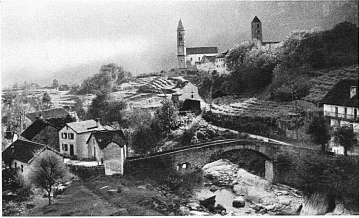
Giornico. Vue sur Giornico et ses deux églises.

fahrtskirche Madonna del Sasso. Durch das wilde Tälchen der Ramogna führt der Weg zu ihr empor. Die Legende ihrer Entstehung ist mit der Schönheit der Landschaft verbunden. Ein Mönch des Minoritenklosters zu Locarno sah in einer blauen Sommernacht des Jahres 1480 die Felsenzacke über der Stadt plötzlich in helles Licht getaucht. Aus diesem erhob sich die Maria im Kreise der Engel. Die Erscheinung veranlaßte den Mönch, dort oben Maria eine Kapelle zu bauen. Er selbst zog als Eremit in ihre Nähe. Aus der Kapelle wurde später eine prächtige Kirche, aus der Klausen ein Kloster. Die kirchliche Wallfahrtsstätte wurde um die Wende zum 19. Jahrhundert auch das Pilgerziel eines naturbegeisterten Zeitalters und mit ihr manches andere geweihte Stücklein Erde im Tessin. Madonna d'Ongero bei Carona, der Monte Bigorio im Hinterland Luganos, Castel San Pietro hoch über dem Talgrund des Mendrisiotto, San Nicolao in Giornico am Zugang zum Gotthard, sie alle sind mit vielen anderen auch Wanderziele der Kunstfreunde geworden.