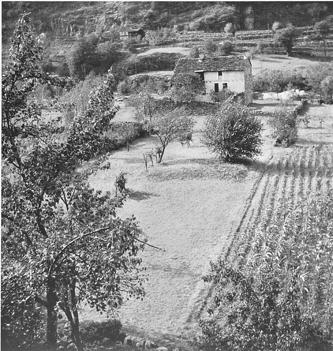
Über den Ufern der Melezza bei Golino, am Tor zum Val Centovalli.