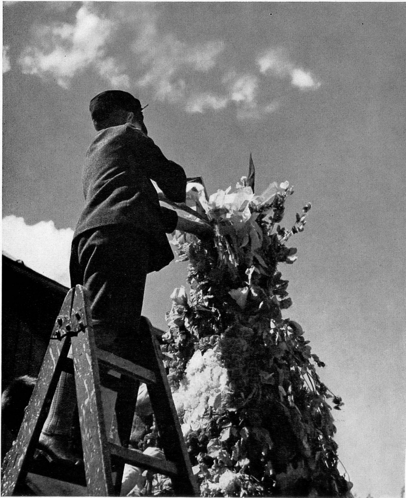
Der Maibär in Bad-Ragaz.