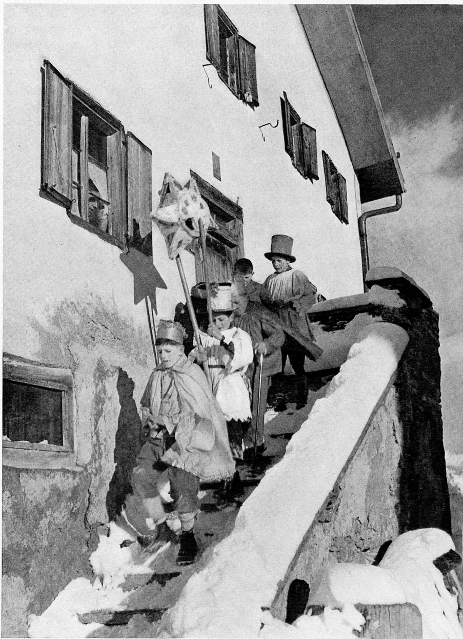
Das Sternsingen in Graubünden.