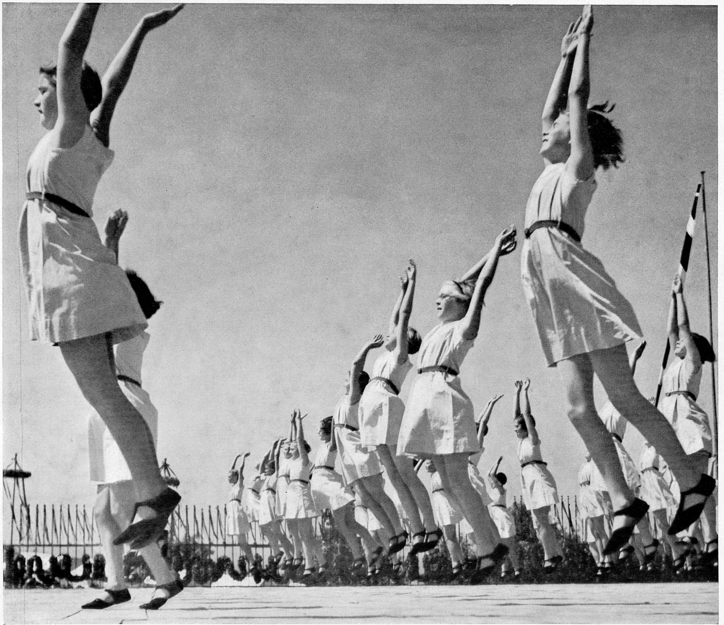
Kinderfest in St. Gallen.