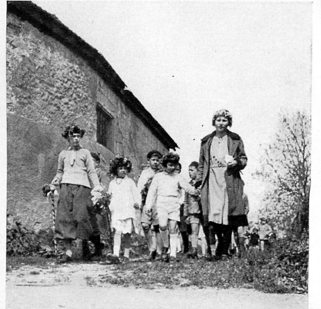
Der «Feuillu», Maibrauch im Genferland.