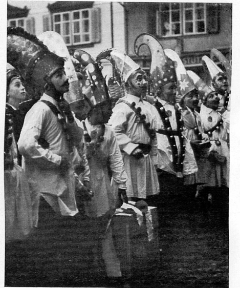
«Geiggel» (St. Niklaus) in Stans.