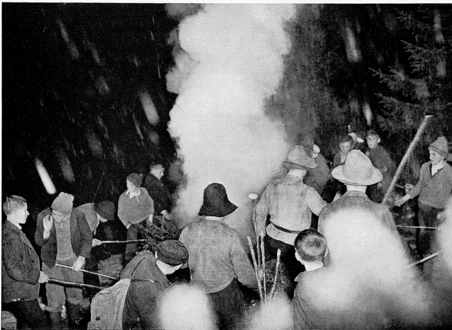
Scheibenschlagen in Matt (Sernftal, Glarus) (Herrenfastnacht).

zumal der Maibeginn, bringt in der Westschweiz eine der lieblichsten Traditionen: das Maisingen der Kinder — im Kanton Genf den «Feuillu» — welche selbst den ganzen Reiz der fruchtbaren Gegend in sich schließen, und die auch manche Komponisten unseres Welschlandes begeistert und angeregt haben.