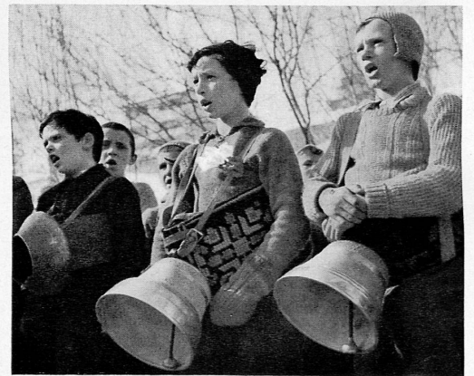
Chalanda Marz im Engadin (1. März).

Der Sommer ist die Zeit der Jugendfeste. Im Aargau und im Bernbiet, im Kanton Zürich und in der Ostschweiz werden die lebensfrohen, andächtig beginnenden und in übermütige Tanzfreude mündenden Feiern begangen. In den kleinen Städtchen des Mittellandes, wo wir so getreu den Geist wiederfinden, der in Gottfried Kellers Seldwyler Novellen verewigt ist, sind sie am Orte wie sonst kaum irgendwo. Aber auch zahlreiche größere Städte pflegen diese Tradition. Wer kennt nicht die prächtigen Kinderfeste der Stadt St. Gallen? Wer hat nicht schon von den «Fêtes des promotions» Genfs gehört? Bekannt ist die «Fête des Bois» in Lausanne; berühmt sind die Aargauer Feste, sei es von Lenzburg, von Zofingen, seien es der Brugger Rutenzug oder der Aarauer Meienzug. Stets, bei den Vorbereitungen und bei der Durchführung, vom frühen Morgen bis spät am Abend, spielt da die Jugend die Hauptrolle, und für sie bedeuten die in der Heimat verwurzelten Feste unvergeßliche Erlebnisse, an welche die Erinnerung zeitlebens hochgehalten wird. — Am deutlichsten aber erscheint der vaterländische