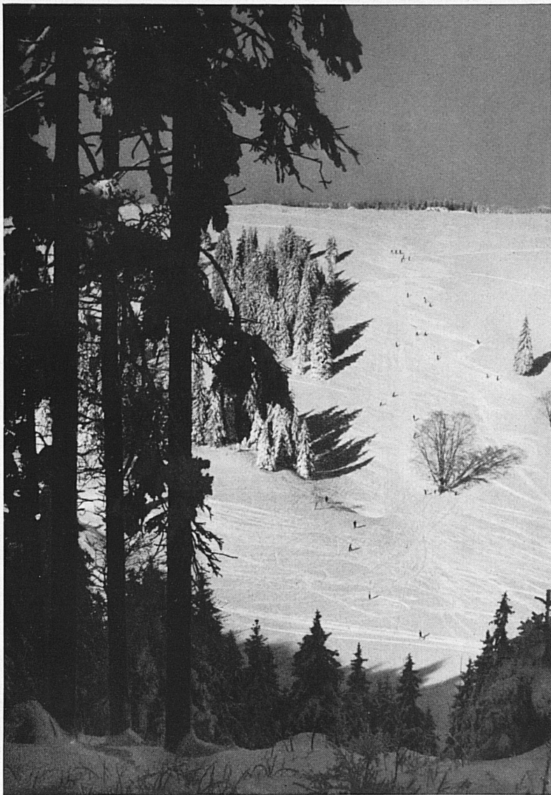
Le Jura neuchâtois, près de la Vue des Alpes.* Die prachtvollen Hänge im Neuenburger Jura, in der Gegend der Vue des Alpes.