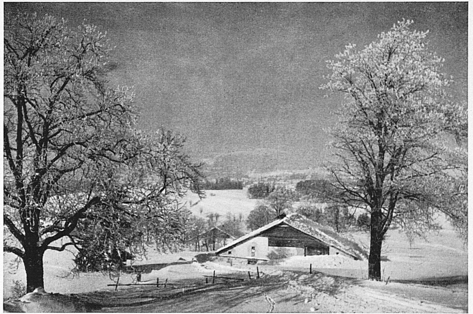
Dans les environs de La Chaux-de-Fonds.* — In der reizvollen Umgebung der jurassischen Metropole.

C'est dans ce terrain varié qui a favorisé l'entraînement de tant de grands champions, que se disputera, le 18 février prochain, la XIX me Course nationale de ski de grand fond 50 km. Le Jura, pays