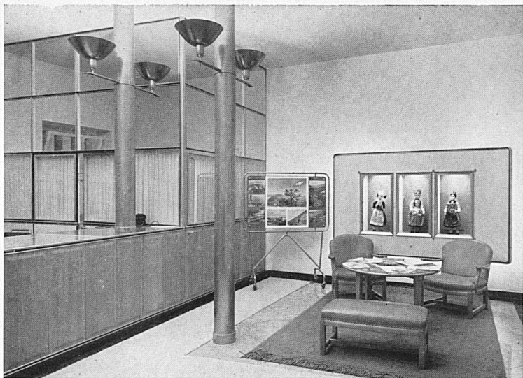
La salle de réception de l'agence. — Der Empfangsraum der Agentur.