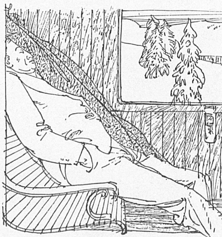
Zeichnungen: Hugo Wetli, Genf.

durch Werkstätten, Depots und Betriebsanlagen sollen organisiert werden. Das erwähnte Jubiläumssbuch soll als populäre Schrift der Herausgabe des großen, vom Eidg. Amt für Verkehr in Auftrag gegebenen wissenschaftlichen Fachwerkes vorangehen; weitere Arbeiten wie das bereits erschienene Büchlein von Ernst Mathys über die «Männer der Schiene» seien nicht vergessen. In sehr mannigfaltiger Weise wird, wie wir sehen, der «100 Jahre Schweizer Bahnen» gedacht — ihrer behutsamen Anfänge, ihrer wechselvollen Entwicklung wie ihrer heutigen Bedeutung. Der modernen Zeit angepaßt, rasch und bequem, sauber und sicher werden die schweizerischen Eisenbahnen im kommenden August über die Schwelle ihres zweiten Jahrhunderts gleiten, bereit, ihre Aufgabe zum Wohle des ganzen Volkes auch weiterhin zu erfüllen. Sch.