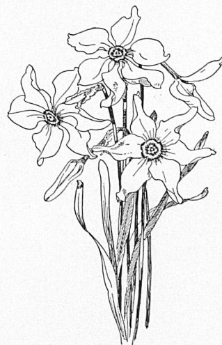
Dessin de Pia Roshardi.

Et pour ceux qui n'auront pas trouvé de place à l'une des trois représentations, il leur restera d'aller assister au feu d'artifice et prendre part à la bataille de confetti en prenant garde toutefois de se laisser ensevelir sous leur masse de peur d'être balayés le lendemain et emportés dans l'amas des petits papillons morts.