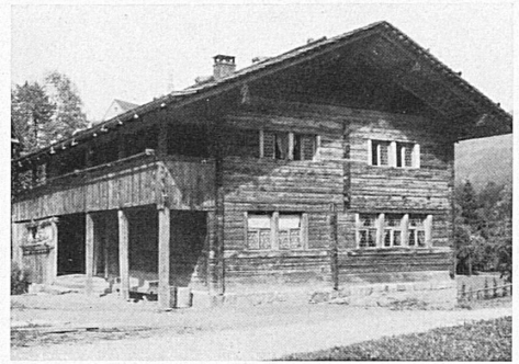
Links: An der Feier vom Pfingstsonntag in Sachseln wirkten u. a. auch die Grenadiere aus dem Lötschental mit. Die Bruderklausenstatue wird aus der Kirche getragen. — Oben: Das Geburtshaus Niklaus von Flües auf dem Flüeli. — A gauche: Le dimanche de Pentecôte, à Sachseln, les Grenadiers du Lötschental prêtèrent leur concours à l'occasion de la fête célébrée en l'honneur du Saint. On sort de l'Eglise la statue de Nicolas de Flüe. — En haut: La maison où naquit Nicolas de Flüe, à Flüeli.