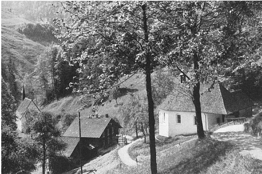
Links: Die Kapellen im Ranft. — A gauche: Les chapelles du Ranft. Photo: Gemmerli.

Links unten: Grabmal Bruder Klausens in der 1679 mit der Kirche zusammen neubauten Beinhauskapelle zu Sachseln. — Unten: Das älteste, 1945 wieder aufgefundene Bildnis des Heiligen (1492); es zierte die Außenseite eines Flügels des einstigen Hochaltars der Sachslar Pfarrkirche. — A gauche, en bas: Tombeau de Nicolas de Flüe dans l'ossuaire de Sachseln, construit en même temps que l'Eglise en 1679. — En bas: Le plus ancien portrait du Saint (1492) retrouvé en 1945; il orna le côté extérieur d'une aile de l'ancien retable gothique de l'Eglise paroissiale de Sachseln. Photo: Gemmerli, F. Schwitler AG. (aus Zeitschrift für schweizerische Archäologie und Kunstgeschichte).