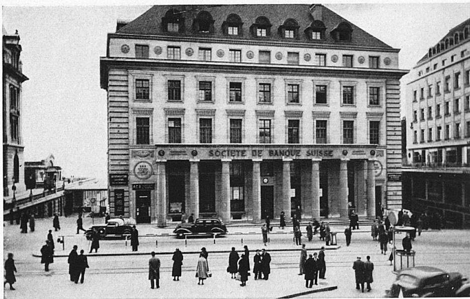
Hôtel de la banque à Lausanne