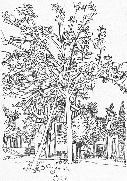
Zeichnungen von F. Krumenacher, R. E. Moser, H. Wetli.

An einem Herbsttage, der mit sanfter Sonne in der freundlichen Bläue des Himmels seine Helligkeit milde in die Bauernküche einließ, trat ich vor das Haus, lehnte mich an den steinernen Türpfosten und sah über den Hof. Wer zu solcher Stunde noch nie auf dem Lande weilte, der kennt die glashellen Herbsttage nicht, an denen sich bei Biswind und klarer Sonne der See in fast südlich azurner Bläue erstreckt wie ein grenzenloses, unabsehbares Gewässer, an dessen südlichem Rande dann die fernen Alpen in durchsichtig hauchzarter Zeichnung stehen. Gerade noch erkennt man sie an den hier und dort weiß-silbernen schimmernden Schneehalden und Ewigschneekuppen, die aber auch wieder träge am Himmel lagernde weiße Wolken sein könnten, so innig verschmolzen und ineinanderrinnend sind die Konturen der himmelragenden Eisriesen und des herbstlichen Gewölks. Wie ein Buchhalter der Sonne scheint der Herbst kugelrund dazustehen, die Finger zwischen die Armlöcher der Weste gesteckt, weil er stolz ist auf die Fülle, die er zu geben vermag.