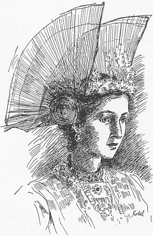
Tracht aus Innerrhoden.

Der Schweizer Held der Freiheit war und bleibt der Tell, und Arnold Winkelried mit seinem Opfertod steht neben ihm. Der heilige Klaus von Flüe aber wurde ihr Held der Liebe, die nach den Worten des Evangelisten das Größte ist unter ihnen.