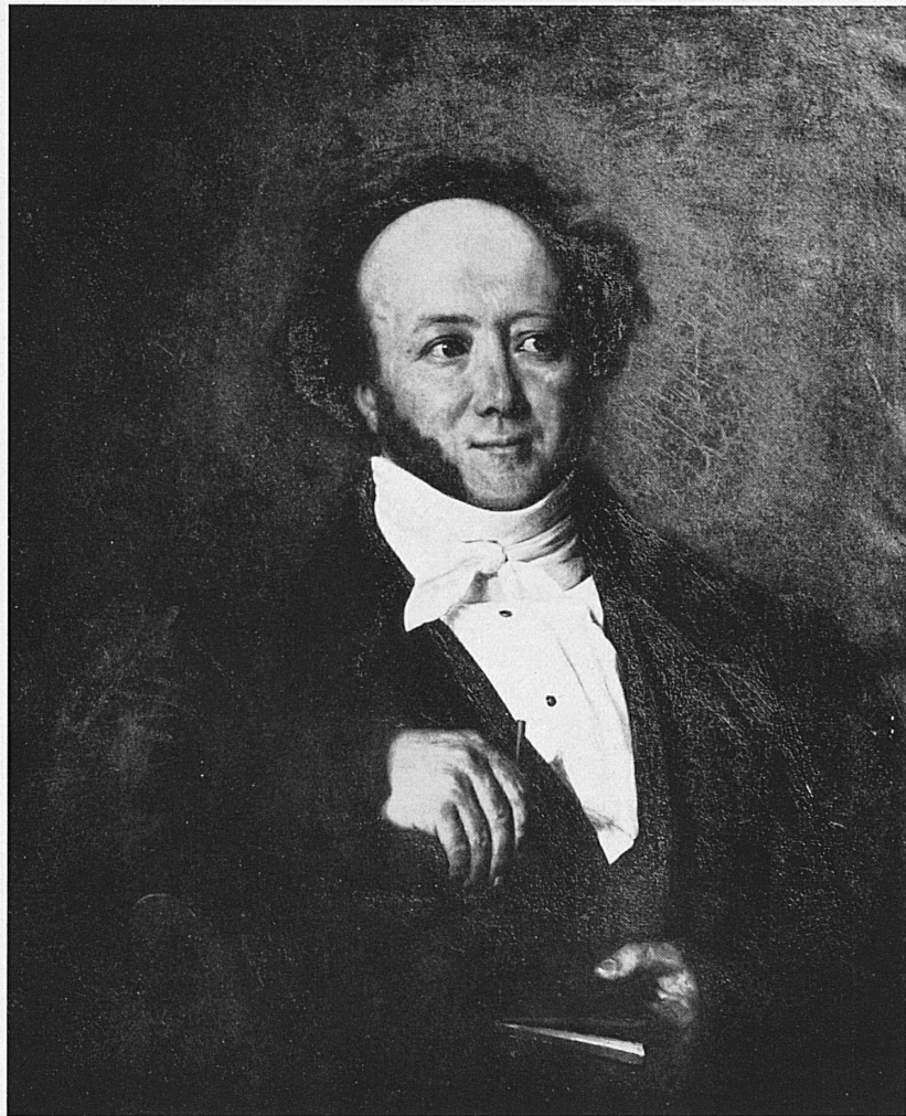
Oben: Wenig bekanntes Bildnis Jeremias Gotthelfs aus der Stadtbibliothek Bern. — En haut: Portrait peu connu de Jeremias Gotthelf. Bibliothèque municipale de Berne.

Als am Neujahrstag 1831 der junge Pfarrvikar Albert Bitzios von Bern nach Lützelflüh hinübertritt, um seine neue Stelle anzutreten, hatte er selber noch keine Ahnung, daß ihm sein Beruf, die wachsenden Schwierigkeiten, nicht zuletzt jedoch die Zustände in seiner Gemeinde und dem Bernbiet einstmals die Feder in die Hand zwingen würden. Sagt er später doch selber: «Ich kam zum Schreiben, ohne alle Vorbereitung und ohne daran zu denken, eigentlich Schriftsteller zu werden, Volksschriftsteller. Aber das Armenwesen, die Schule stunden in Frage.» So hat denn Gotthelf nicht sensationelle Romanfiguren geschaffen, die aus ungewöhnlichem Milieu in ungewöhnliche Schicksale geworfen werden. Er ist vielmehr ein ausgesprochener Realist, der keine Kompromisse kennt, nie und niemandem gegenüber Rücksicht nimmt — es wären denn die Verachteten und Unterdrückten, die Waisen und Verdingkinder, deren tatkräftiger Anwalt er wird. Damit jedoch macht er sich Feinde bei jenen Herrenbauern, die wie Könige auf ihren reichen Höfen sitzen und deren Selbstherrlichkeit und Geiz Jeremias Gotthelf mehr als einmal in ein scharfes Licht zu setzen verstand. So ist es denn kein Wunder, daß man noch heute im Emmental da und dort schroffer Ablehnung begegnen kann, wenn man von Gotthelf und seinen Werken spricht.