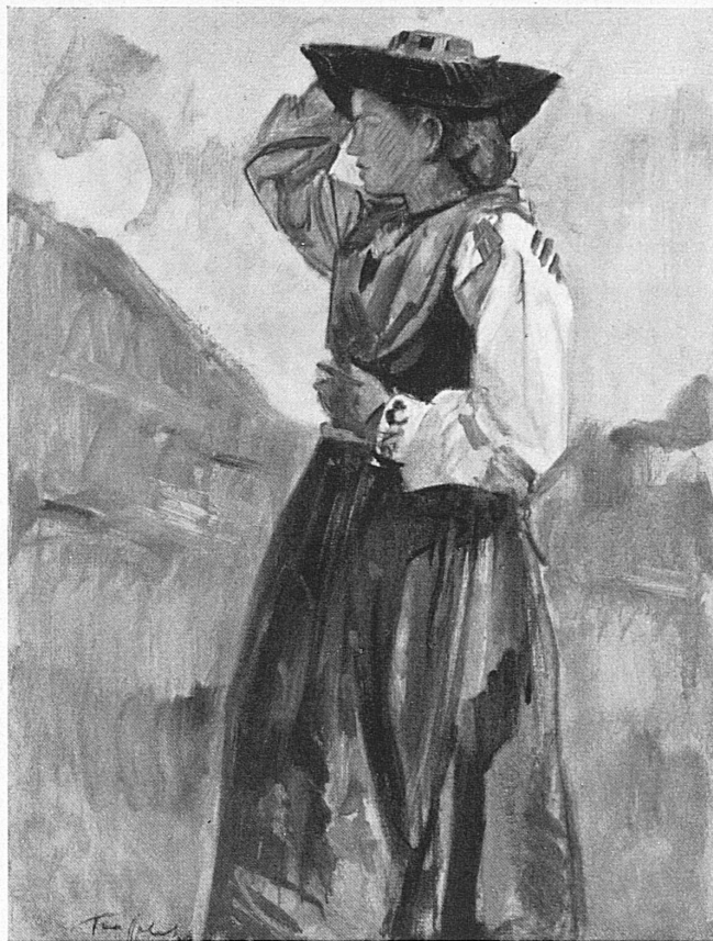
Walliserin in der Tracht. Valaisanne en costume.