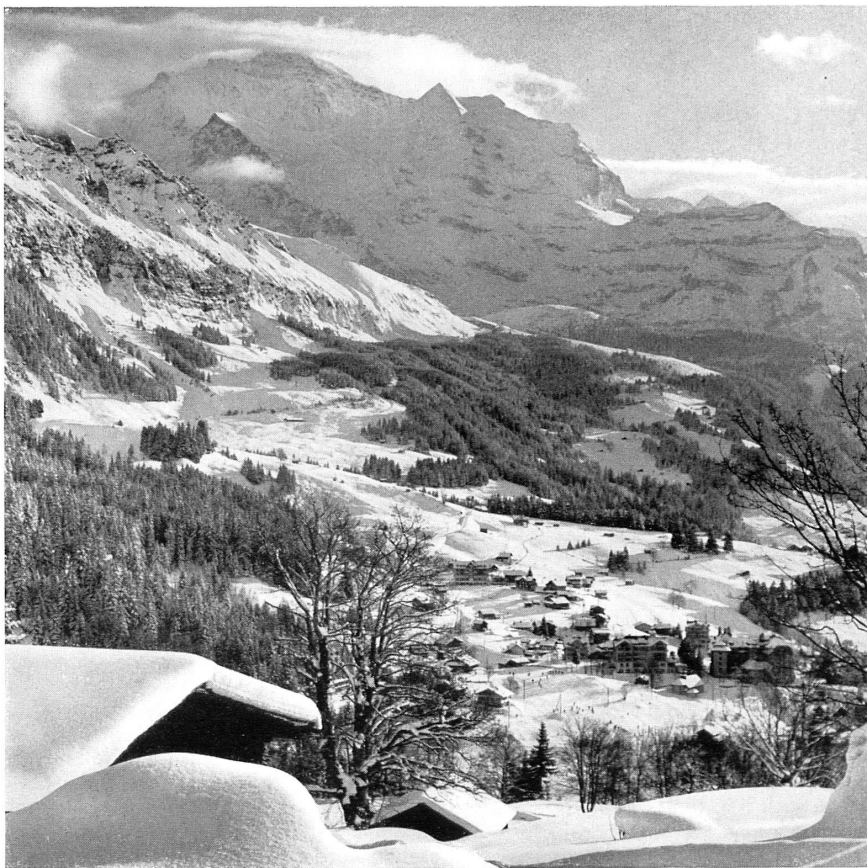
Oben: Blick auf Wengen, gegen die Wengernalp und die Jungfrau. — Unten: Die Abfahrt von der Wengernalp. — En haut: Vue sur Wengen, du côté de la Wengernalp et la Jungfrau. — En bas: Descente de la Wengernalp.