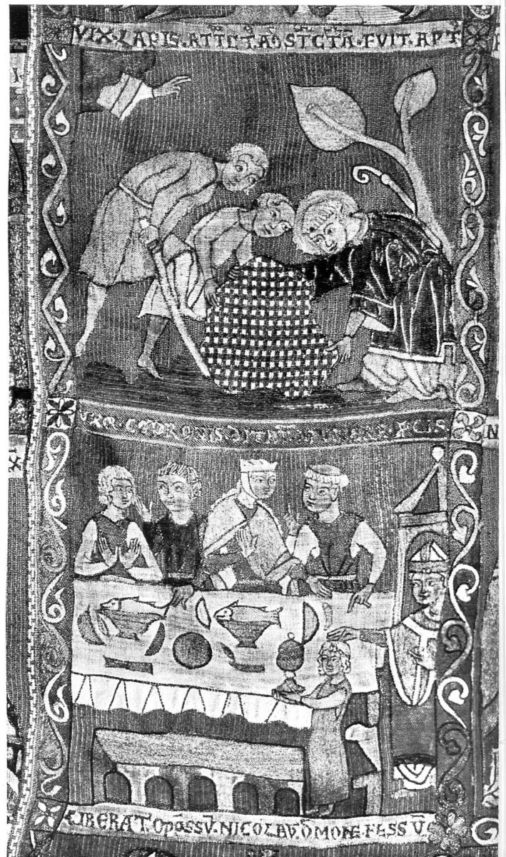
Glockenkasel aus St. Blasien im Schwarzwald, süddeutsch, 13. Jh.