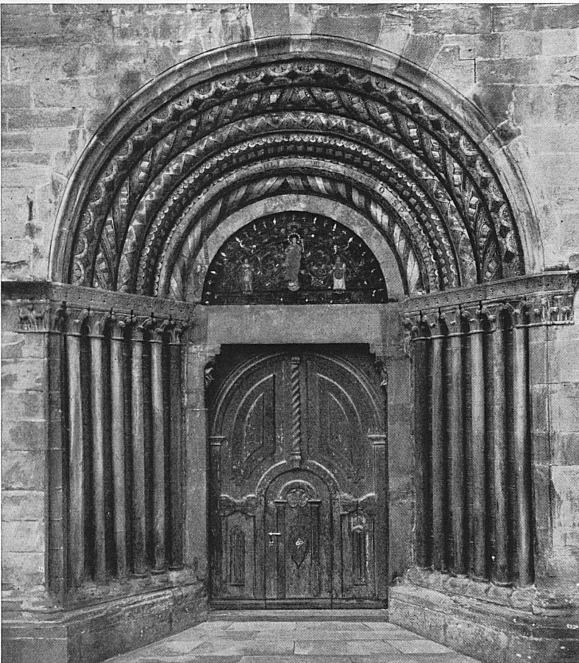
Oben: Das edle romanische Portal der Kathedrale Chur. — En haut: Le somptueux portail en style roman de la cathédrale de Coire.

Zur Herausgabe des 7. und letzten Bandes der «Bündner Kunstdenkmäler»