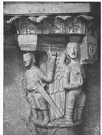
Oben sowie oben an der Seite: Romanische Kapitelle im Altarhaus der Kathedrale Chur. — Links: Das prächtige, Daniel in der Löwengrube darstellende Kapitell. — En haut et de côté: Chapiteaux romans dans le chœur de la cathédrale de Coire.