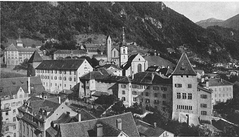
Oben: Blick über die Dächer der Altstadt von Chur auf den «Hof», die bischöfliche Residenz mit der Kathedrale. — En haut: Coire: par-dessus les toits de la vieille ville, le regard plonge dans le «Hof», la résidence épiscopale avec la cathédrale.