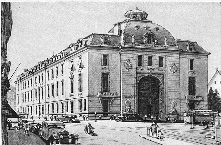
Bankgebäude in Zürich - Hôtel de la banque à Zurich