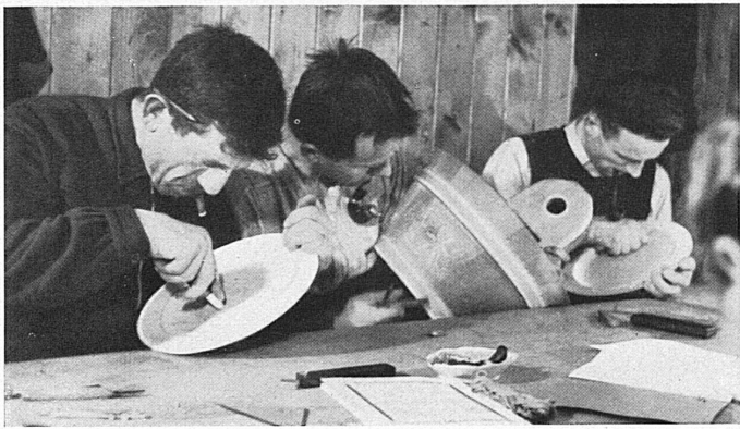
Im Schulhaus gibt's eine Gemeindestube, die sich für solche Zwecke gut eignet — was tut's, wenn man etwas eng sitzt! Gegen zehn Uhr bringt dann ein guter Geist «Kaffee und Guetzi», das hält die Kursfamilie nochmals eine Stunde munter.

Manch ein Kursbesucher hat zu Hause auf dem Estrich oder im Spycher Umschau gehalten nach alten, vergessenen Stücken und sie als Anregung mitgebracht. Man möchte hoffen, daß die Zeit, da gutes bäuerliches Kunstgut zu Schleuderpreisen in die Städte verkauft wurde, endgültig vorüber sei.