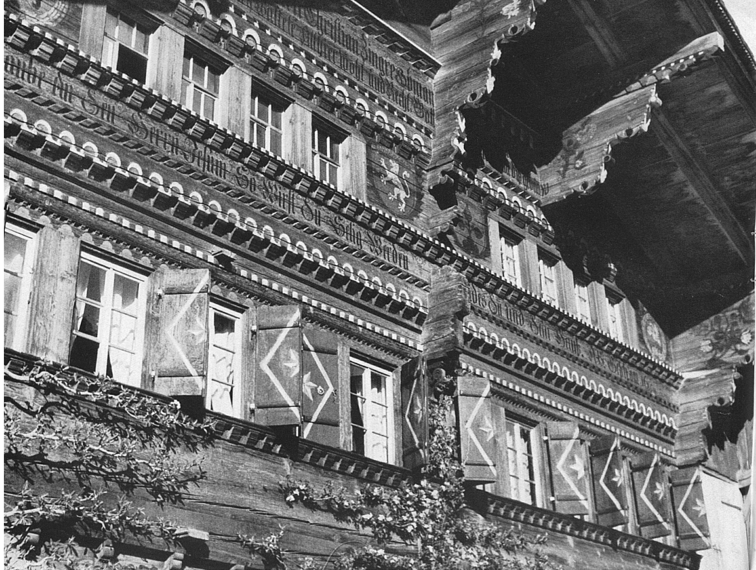
Oben: Reich ornamentierte Fassade eines Berner Oberländer Hauses.