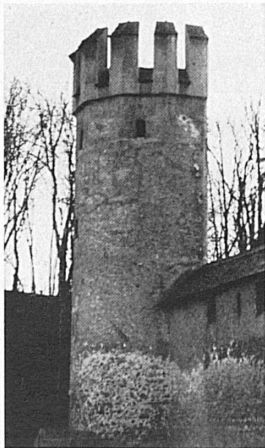
Ein Rest der Ringmuer mit zwei charakteristischen Wehrtürmen ist im St.-Alban-Tal, dem sog. «Dalbeloch», rheinaufwärts vom Stadtzentrum, noch erhalten.