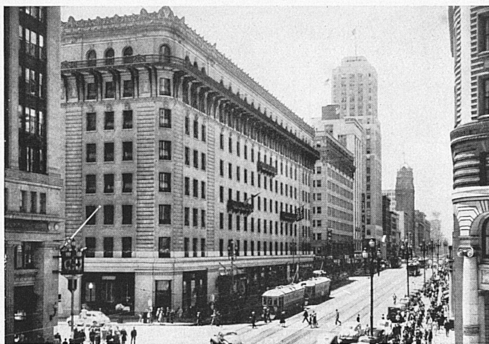
Oben: Die Agentur San Franzisko befindet sich an der belebten Market Street, im Erdgeschoß des großen Blocks des Palace-Hotels (Bildmitte). — En haut: L'agence de San Francisco se trouve à la Market Street, au rez-de-chaussée du grand bloc du Palace-Hôtel.