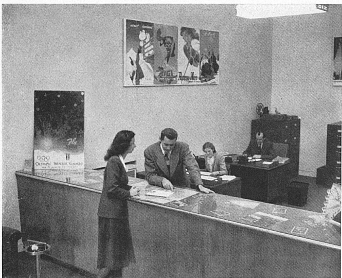
Oben: Im Auskunftsräum der Agentur. — En haut: Au comptoir de l'agence de San Francisco.

Küste gelegenen Staaten Washington, Oregon und Kalifornien sowie die acht sog. Bergstaaten Idaho, Montana, Wyoming, Nevada, Utah, Colorado, Arizona und New Mexico. Ihre Gruppierung ist ein relativ neuer wirtschaftspolitischer Begriff, der aber bereits