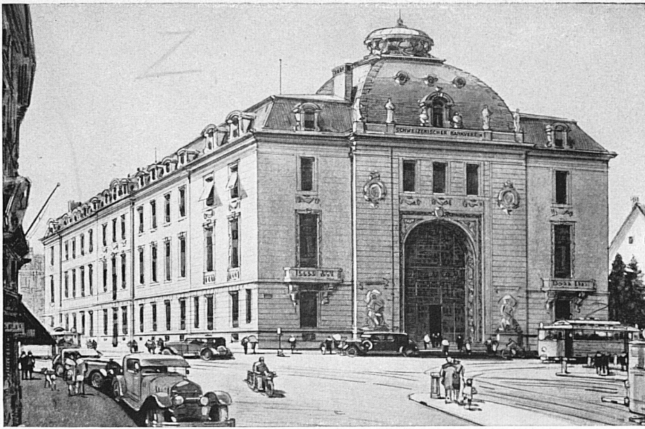
Bankgebäude in Zürich - Hôtel de la banque à Zurich