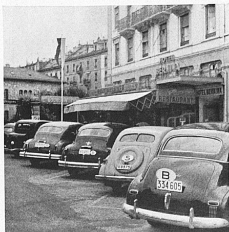
En haut: Les rues sont bordées de rangées d'autos. — Oben: Lange Reihen stationierter Wagen säumen die Straßen.