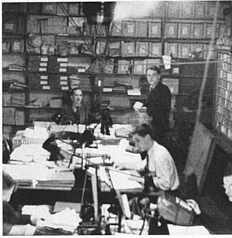
Ein großer Teil der Arbeiten mußte vom Personal der Agentur London bisher in dumpfen Keller-räumen bewältigt werden. — A large part of the work at the London Agency formerly had to be done in dismal cellar rooms.