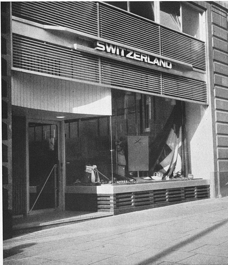
Oben: Großzügig ist die Gestaltung der Fassade der neuen Agentur gelöst worden. — Unten: O. Ernst, Chef der Agentur London der SZV. — Above: The façade of the new Agency building.