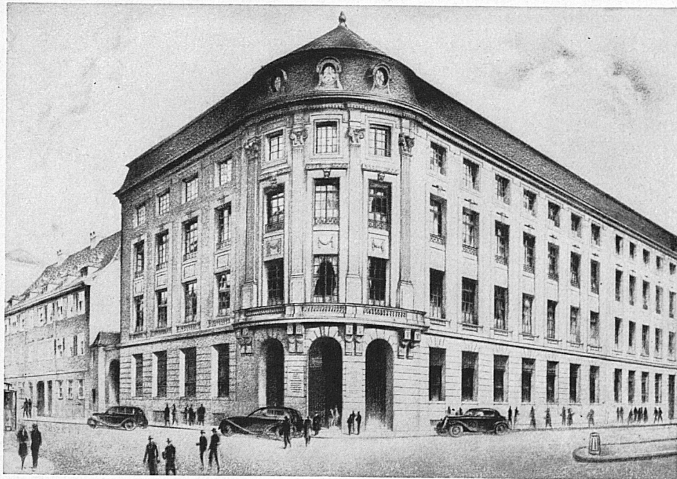
Bankgebäude in Basel - Hôtel de la banque à Bâle