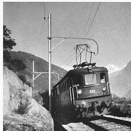
Oben: Zug der Lötschbergbahn auf der Südrampe. — En haut: Un train du Lötschberg sur le versant sud de la ligne. — Above: Train on the southern slope of the Lötschberg Line.

you comfortably through the towns of Thun and Spiez on the Lake of Thun, up the steep and rugged valley of the Kander, through the famous Lötschberg Tunnel, and down into the Rhone Valley to Brig (8:04). After Brig, the Simplon Tunnel, and Domodossola, you'll catch glimpses of the blue of Lake Maggiore framed under grey-