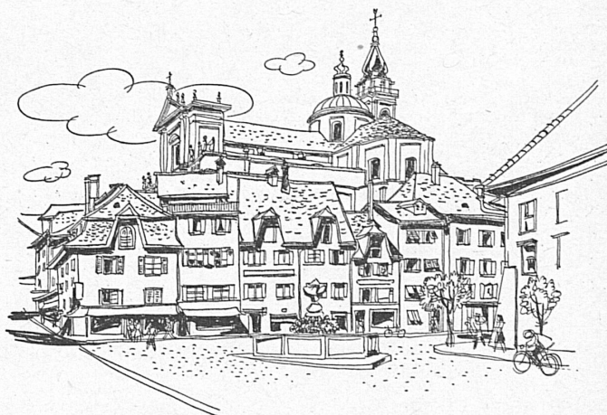
La cathédrale de St-Ours, à Soleure. — Die St.-Ursus-Kathedrale in Solothurn.