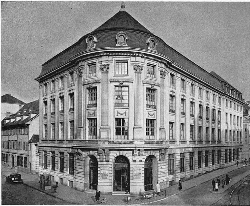
Bankgebäude in Basel - Hôtel de la banque à Bâle