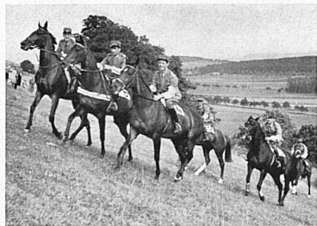
Une phase du cross-country pour officiers (courses de 1947).

taculaires et auxquelles se prête particulièrement bien la nature du terrain, et enfin le Grand-Prix de Porrentruy, steeple-chase de 4200 mètres. Tout permet d'augurer un beau succès, si, comme on peut l'espérer après tant de semaines grises, le soleil est de la partie.