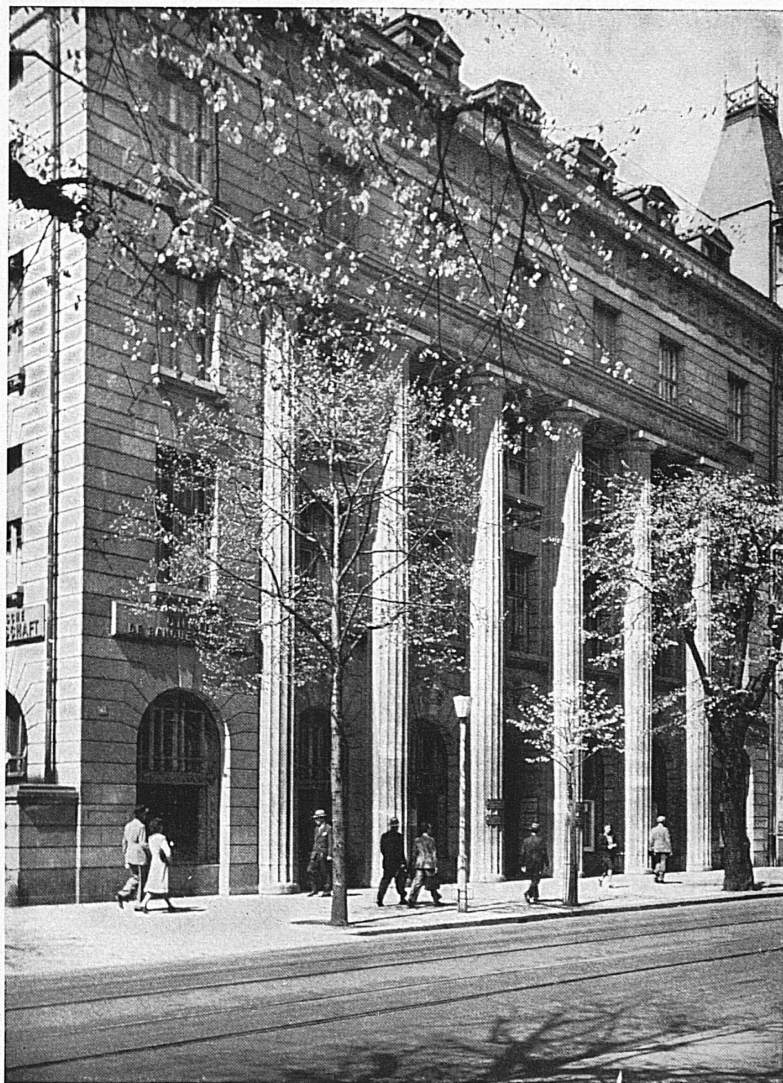
Bankgebäude in Zürich