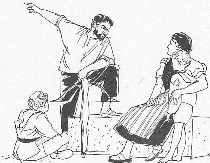
Tell mit den Seinen. — Guillaume Tell avec les siens. (Tellspiele Altdorf)

erst in gedrängten Reihen sitzen und aus dem Mund der Männer und der Frauen die alten, längst bekannten Verse hören, so fühlen wir, wie neues Leben aus ihnen sprüht. Kaum einer der Zuschauer wäre, der sich an dem nicht ganz korrekten Theaterdeutsch stieße; im Gegenteil — der herbe, rauhe Ton der Sprache, der schwere Gang