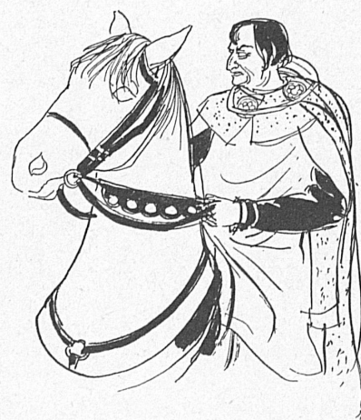
Gessler. (Tellspele Altdorf)

ein einziger Berufsschauspieler in den Ring; alle, die kommen und handeln, entstammen der ansässigen Bevölkerung. Und immer wieder haben sich seit dem ersten Wagnis des Freilichtspiels im Sommer 1931 Gestalten unter den Akteuren gefunden, die uns