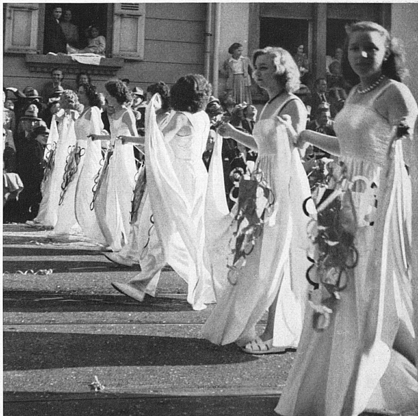
Ci-dessus: Joyeux détails de la Fête des Vendanges de Neuchâtel; à gauche: bataille de confetti; à droite: groupe de ballet du cortège. — Oben: Fröhliche Einzelheiten vom Neuenburger Winzerfest. Links: Konfettischlacht; rechts: Ballettgruppe aus dem Festzug.