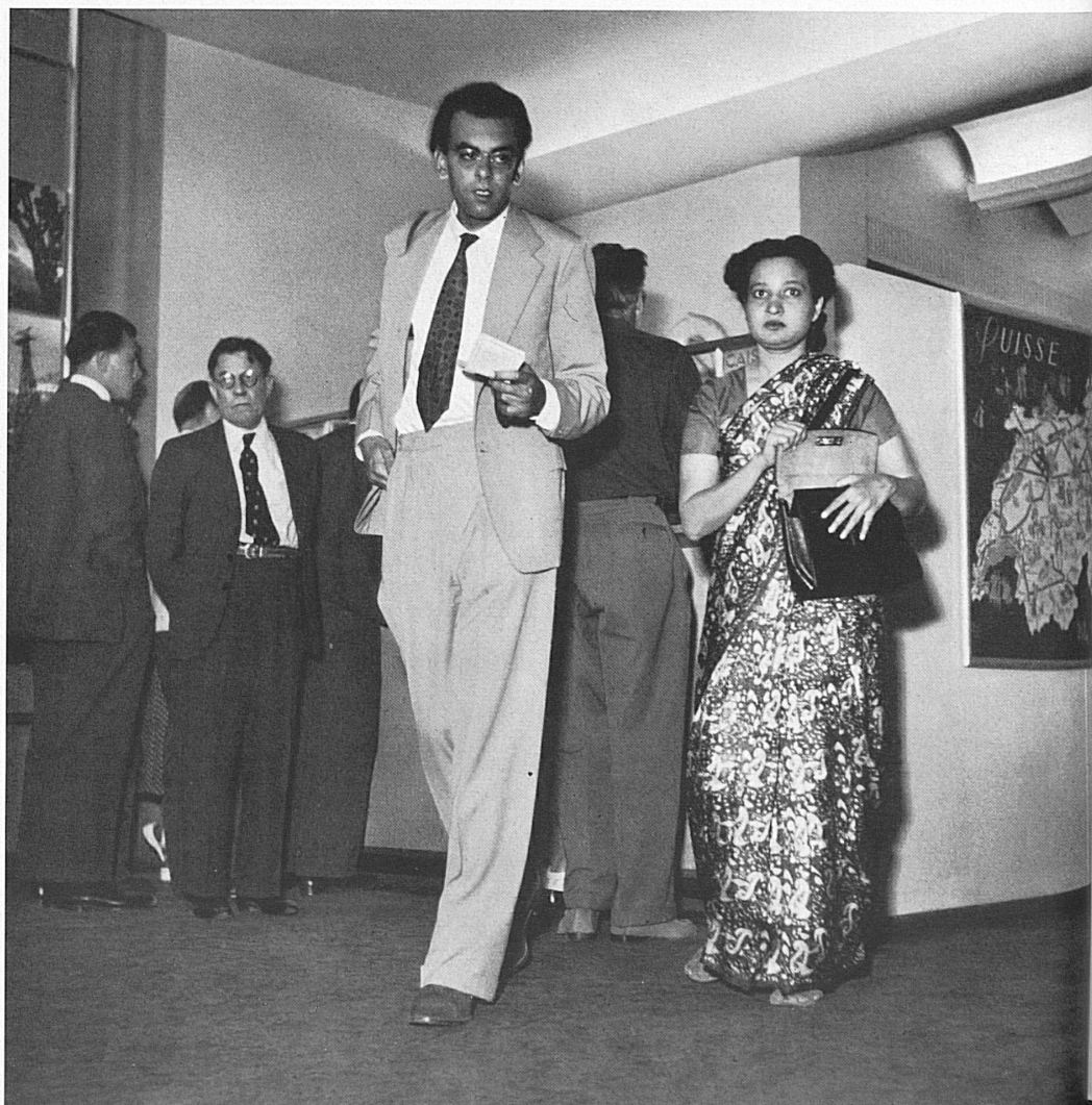
A droite: Les futurs hôtes de la Suisse se donnent rendez-vous dans les agences de l'O. C. S. T. Voici un couple d'Hindous que l'on remarque à peine parmi la multitude de clients de toutes nations qui se pressent à l'agence de Paris. — Rechts: Schweizer Gäste aus aller Herren Ländern geben sich in den Agenturen der SZV Rendezvous. Hier ein indisches Ehepaar, das unter den übrigen internationalen Kunden des Pariser Büros gar nicht so auffällt, wie man es vermuten könnte.

den Gast beginnt vielmehr schon bei ihm zu Hause. Den sechzehn ausländischen Agenturen der Schweizerischen Zentrale für Verkehrsförderung kommt in diesem Rahmen die größte Bedeutung zu. Ihre Leiter wirken — um ein kürzlich ausgesprochenes Wort des Präsidenten des Schweizerischen Hoteliersvereins, Dr. Franz Seiler, zu gebrauchen — als wahre Ambassadeure des schweizerischen Tourismus, der schweizerischen Kultur, oft unseres Landes schlechthin. Die Werbung für unsern Fremdenverkehr ist dabei