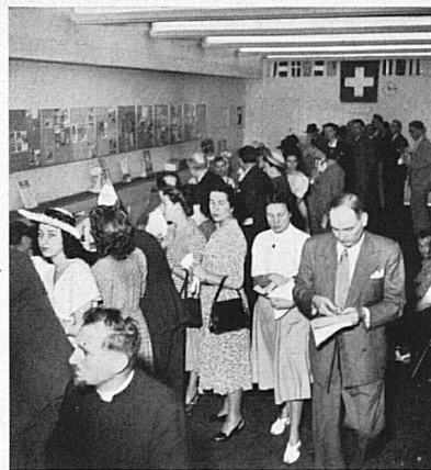
Activité intense dans les locaux d'un office suisse de tourisme. A certaines heures de la journée, l'affluence est telle que les clients sont obligés de faire la queue. — Hochbetrieb in den Räumlichkeiten eines Schweizer Verkehrsbüros. Zu gewissen Tageszeiten wird selbst Schlange gestanden, so groß ist der Andrang.