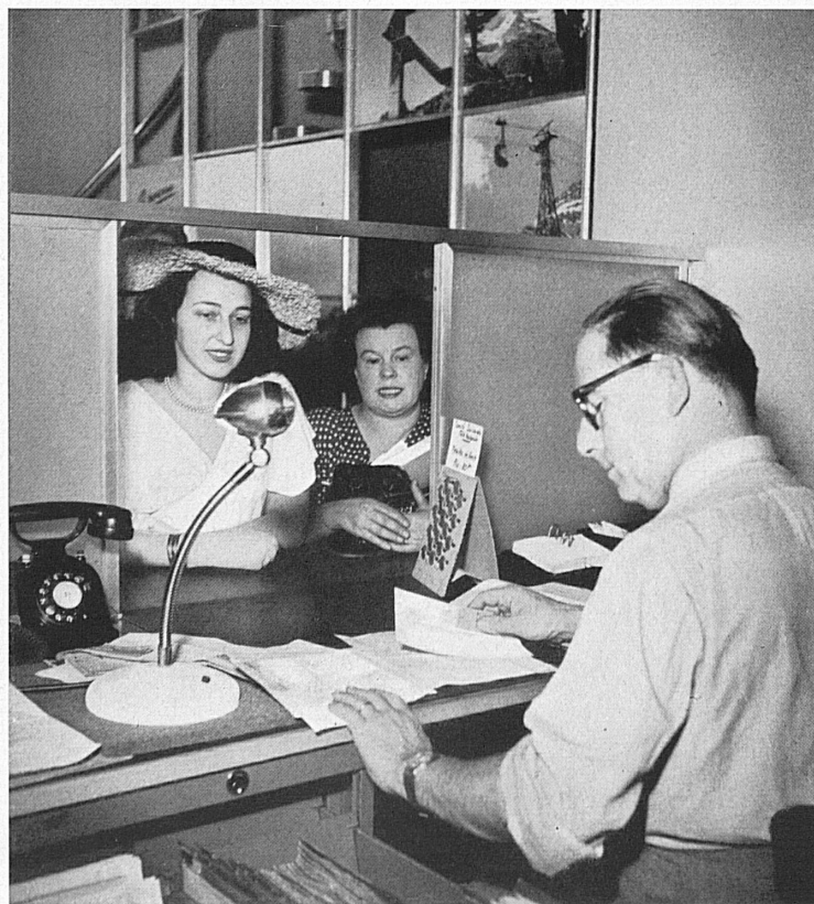
Au guichet, le client est aimablement accueilli et renseigné. Il se sent déjà traité comme un hôte de la Suisse. — In jeder Hinsicht zuvorkommend wird am Schalter bedient. Der Kunde fühlt sich hier schon als Gast der Schweiz.

Les touristes étrangers qui visitent notre pays et y séjournent par milliers chaque année, ne sont pas seulement l'objet d'attentions assidues, une fois la frontière franchie, mais déjà dans leurs pays respectifs, tout est mis en œuvre pour faciliter leur voyage. Ne sont-ce pas eux qui établissent