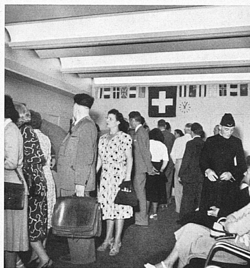
Du directeur de banque à l'ouvrier, de la couturière à l'ecclésiastique, tous ont l'ardent désir de visiter la Suisse. — Vom Bankdirektor zum Arbeiter, von der Schneiderin zum Geistlichen ..., alle wünschen sie nach der Schweiz zu fahren.