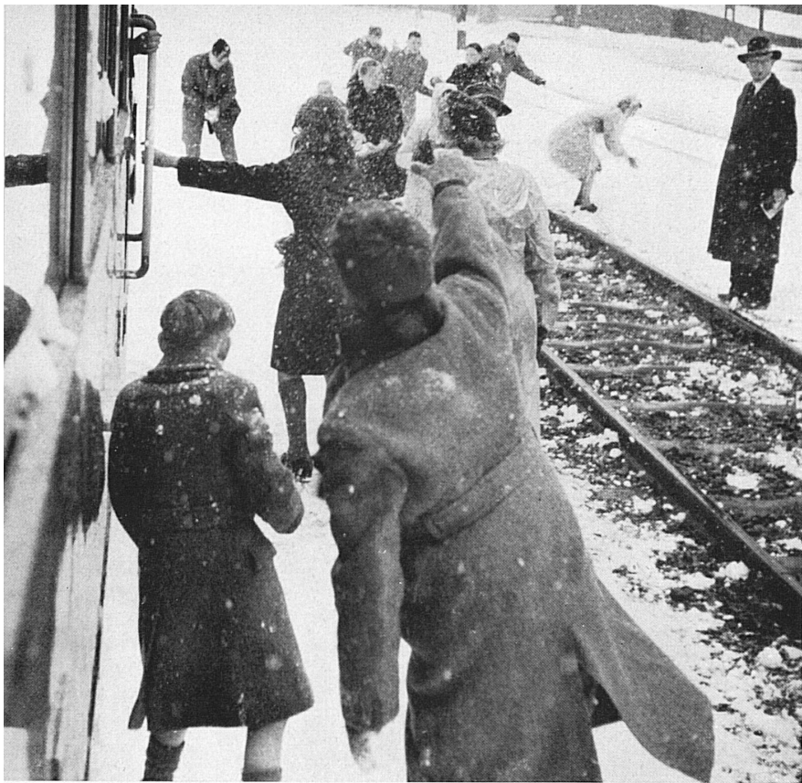
After passing through the Gotthard Tunnel, the children have a snowball fight in Airolo. — Durch den Gotthardtunnel nach Airolo. Hier lieferten sich Buben und Mädchen eine regelrechte Schneeballschlacht.