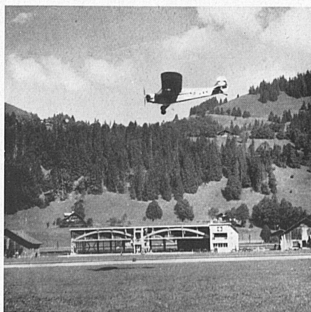
Mit einem gut gelungenen Flugtag wurde der neue Flugplatz von Saanen eingeweiht, der dank seiner landschaftlichen Reize regen Besuch erhalten dürfte. Der neue Hangar weist eine Breite von 40 und eine Höhe von 10 m auf. — L'aérodrome de Gessenay a été inauguré au cours d'une journée d'aviation très réussie. Nul doute que le charme du paysage n'y attire de nombreux aviateurs. Le nouveau hangar mesure 40 m. de large et 10 m. de haut.