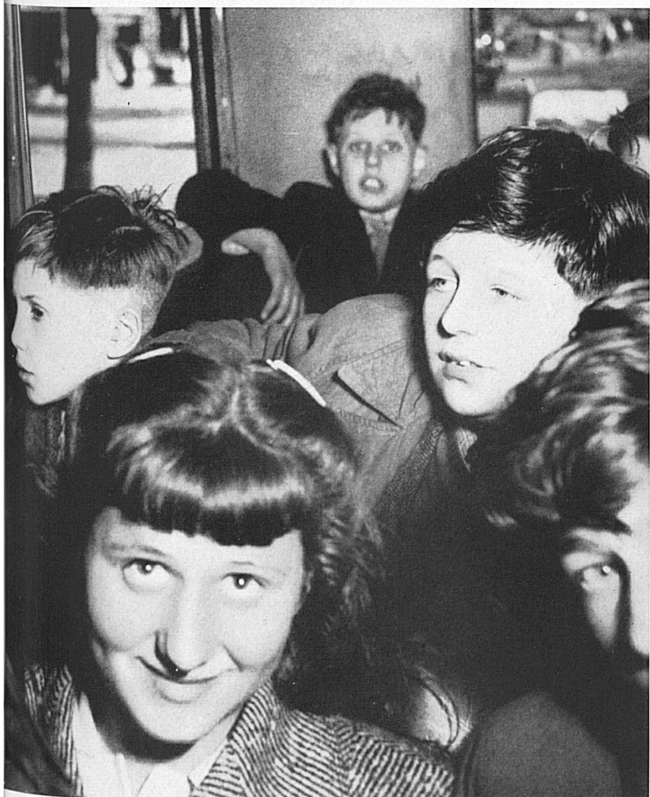
On the way to new discoveries. — Auf einer Fahrt zu neuen Entdeckungen.

Anlässlich der Geburt des Prinzen Charles von England hatte der Hotelierverein der Stadt Luzern in Verbindung mit den Stadtbehörden eine Aktion ins Leben gerufen, welche die Einladung von 50 bedürftigen englischen Kindern im Alter von 10 bis 14 Jahren zum Ziele hatte. Die Auswahl der kleinen Gäste war durch die International Help for Children vorgenommen worden. Sie stammten aus den Städten London, Plymouth, Manchester und Birmingham. Diese Kinder haben den Krieg nicht nur am eigenen Leibe erfahren, die meisten verloren auch ihren Vater im Krieg, manche sind Vollwaisen.