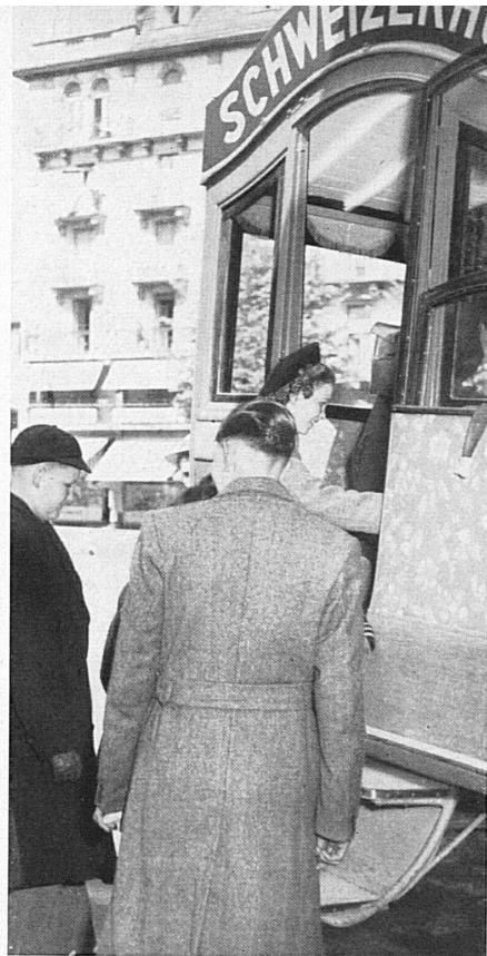
... and you get to the "Schweizerhof". — ... und Ihr kommt in den « Schweizerhof ».