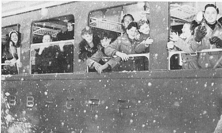
The "Red Arrow" takes the young guests up the St. Gotthard Pass. In Göschenen, real, clean, white snow means fun aplenty. — Mit dem Roten Pfeil nach dem St. Gotthard War das ein Spaß, richtiger, reiner, weißer Schnee in Göschenen!