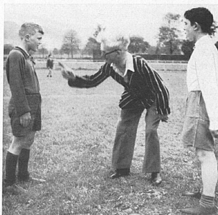
Final instructions for the football match with the Lucerne junior team. — Letzte Instruktionen für den Fußballmatch mit der Luzerner Jungmannschaft.