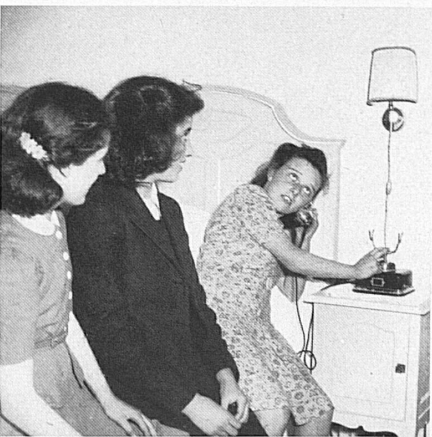
Yes, the room telephone really works. — Tatsächlich, es geht, das Zimmer-telephon!