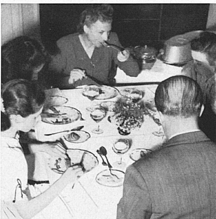
At lunch in the Palace Hotel. — Beim Mittagessen im Palace Hotel.

Amusements provided for the children during their stay in Switzerland included the most beautiful excursions in the Alps, as well as all kinds of young people's entertainment. After a month of rest, healthful play, fresh air and sunshine, the young guests returned to England much improved from their Swiss holiday.