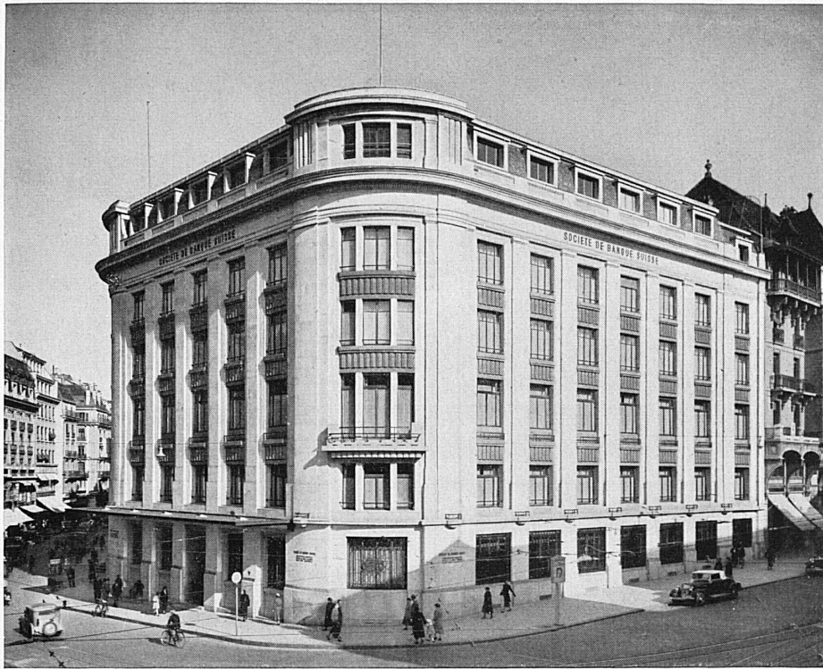
Hôtel de la banque à Genève - Bankgebäude in Genf