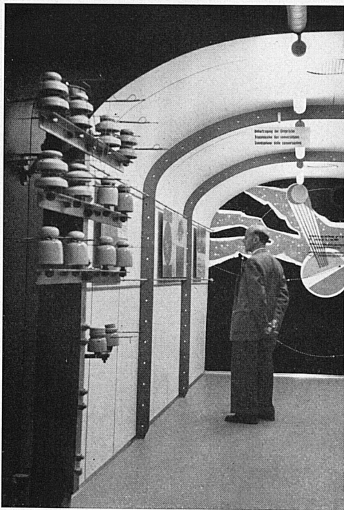
Oben: Die Übertragung der Telefongespräche läßt sich in diesem Wagen des Ausstellungszuges studieren.