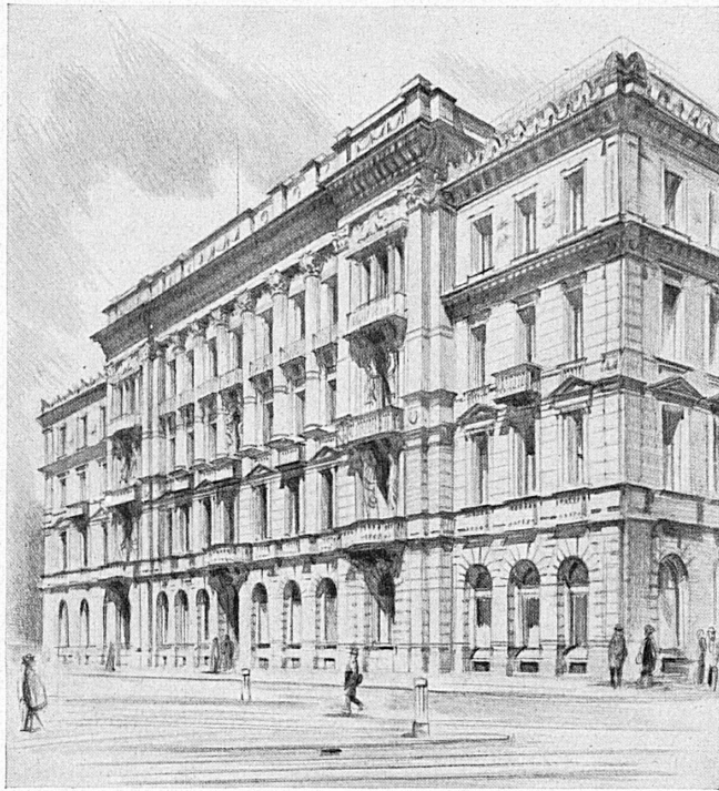
Hauptsitz in Zürich