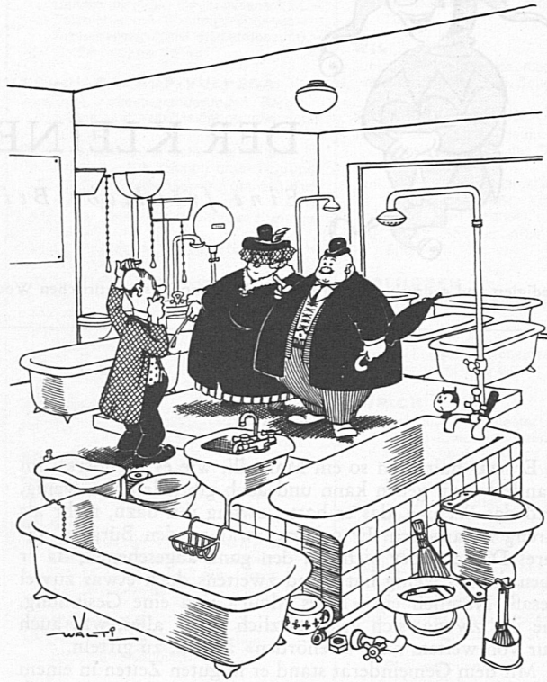
«Wir hätten gern eine runde Badewanne ...»