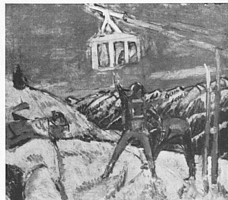
Deutschsprachiger Kommentar zum Titelbild siehe Geleitwort «Auftakt zum Bergwinter».

COPERTINA. Il Museo civico di Soletta ospita attualmente un numero insolito di opere del pittore grigionese Alois Carigiet. Il tema predominante nell'opera dell'artista è il mondo alpestre. Una delle sue composizioni più singolari rappresenta un paesaggio schiuso dal turismo alla vita moderna, visto attraverso il parabrezza di un'automobile. A questo soggetto fa pensare la «Filovia sospesa sui campi sciistici» che abbiamo trovato nello studio del pittore e la cui riproduzione fregia questo numero dedicato alla prossima stagione invernale. Nel tratto e nei colori è palese il vivace e fantasioso temperamento di questo pittore che senza compromessi extra-artistici inneggia coi suoi lavori alla bellezza generale della montagna, divulgando la fama delle stazioni turistiche svizzere.