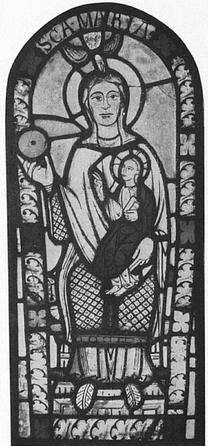
Flumser Marienscheibe, 12. Jahrhundert