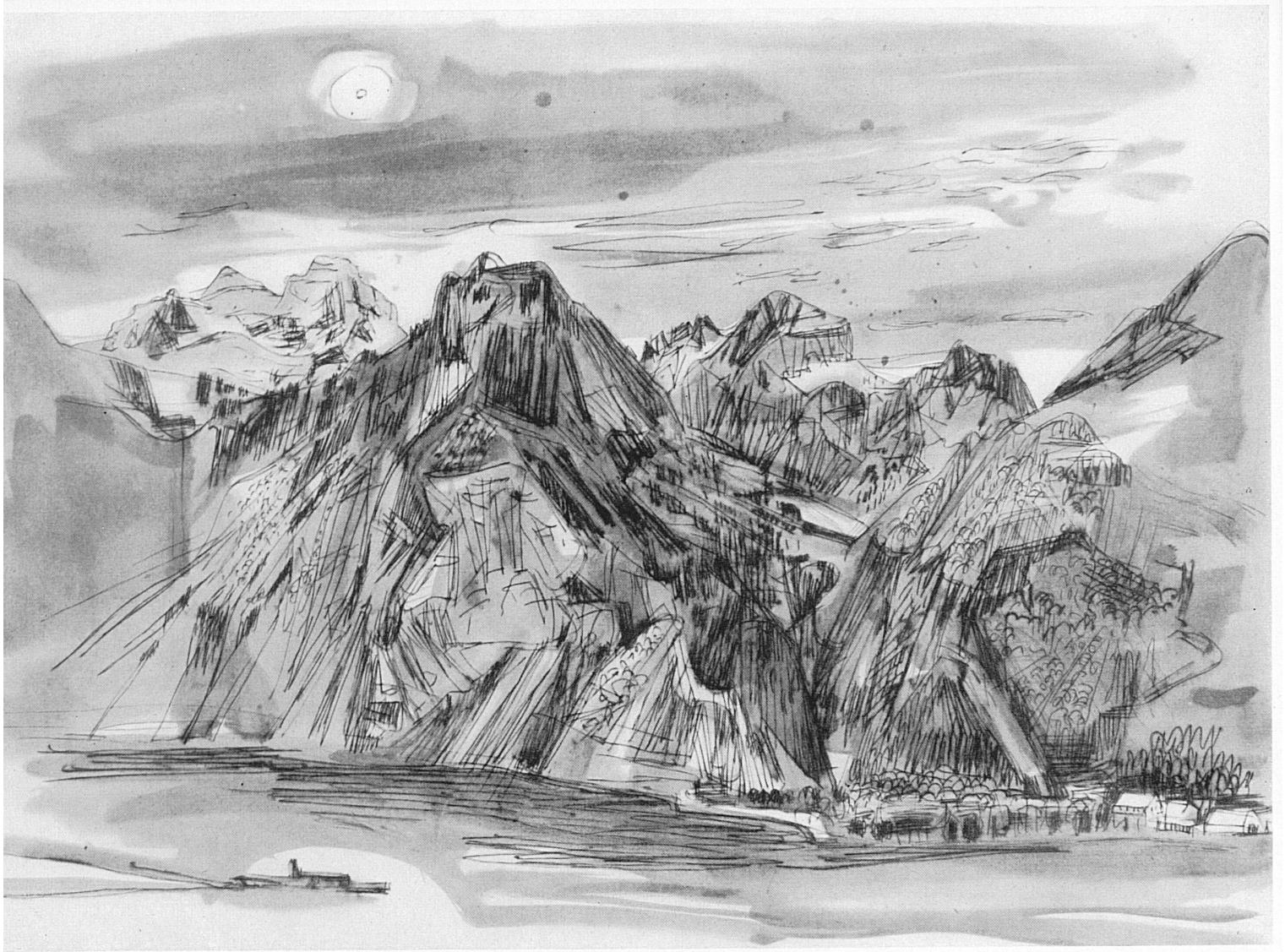
Der Vierwaldstättersee im Herbst. Zeichnung von Heinrich Danioth, 1896–1953; aus «Steile Welt», Verlag Ars Helvetica, Zürich. – Le lac des Quatre-Cantons en automne. Dessin d'Henri Danioth, 1896–1953.