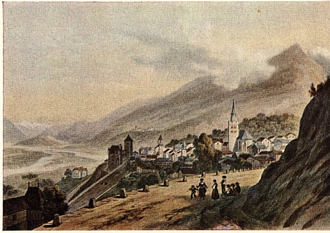
Deroy: Leuk und das Rhoneetal. Loèche et la Vallée du Rhône Leuk e la valle del Rodano. Loeche y el valle del Ródano. Leuk and Rhone Valley.

Very likely the Romans, around 196 A.D., developed an antique mule track into a road across the Simplon. Pilgrims often travelled over the pass in the 11th century. Pope Gregorius X used it in 1275 to go to Lausanne for the inauguration of the Cathedral. The Simplon Pass became more and more important as a link for international trade, especially after Kaspar von Stockalper, a Valais citizen, obtained authorization in 1634 from the city of Milan to transport goods between Italy and Switzerland. After his death there was little traffic across the Simplon, until the month of May 1800 when Napoleon used it as a passage for his soldiers and guns on their way to Italy. Five years later the Simplon pass was made accessible to cannon. Soon afterwards, i.e. about 150 years ago, the first mail coaches drove over it.