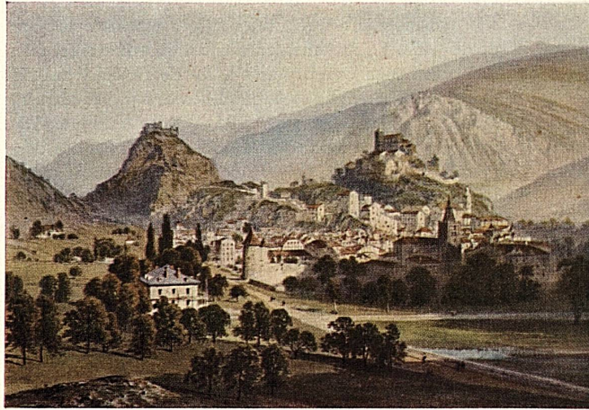
Sitten, die Hauptstadt des Wallis, 1. Hälfte 19. Jahrhundert. Sion, capitale du Valais, dans la première moitié du XIX e siècle. Sion, la capitale vallesana, nella prima metà del secolo XIX. Sion, capital del Valais, 1 a mitad del siglo XIX. Sion, capital of the Valais. First half of 19th century.