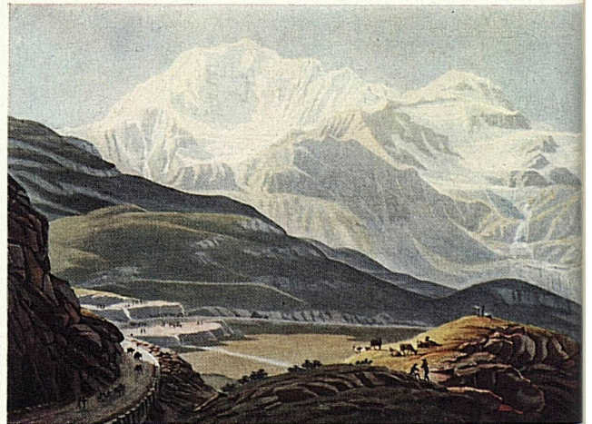
Gabriel Lory fils: Simplonpaß | Col du Simplon | Passo del Sempione | Paso del Simplón | Simplon Pass.

Un antico sentiero mulattiero è alle origini della strada romana sul Sempione, della quale si hanno le prime notizie intorno al 196 d. Cr. Nel secolo XI questo valico alpino fu frequentemente usato dai pellegrini. Papa Gregorio X lo percorse nel 1275, quando consacrò la cattedrale di Lozana. In seguito il valico del Sempione acquistò in modo sempre più pronunciato il carattere di strada commerciale. Esso assurse a importanza europea grazie all'iniziativa del Vallesano Kaspar von Stockalper, al quale i Milanesi accordarono nel 1634 la privativa dei trasporti di merci sul Sempione. Dopo la morte dello Stockalper il transito prese a languire sul passo, finchè nel maggio del 1800 le truppe di Napoleone ruppero il lungo letargo. «Reso praticabile ai cannoni», il valico divenne cinque anni dopo la prima strada carrozzabile delle Alpi e poco tempo dopo, circa 150 anni or sono, fu percorso dalla prima diligenza postale.