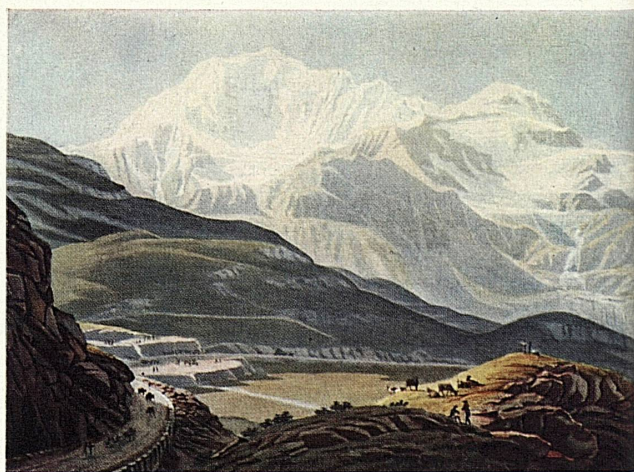
Gabriel Lory fils: Simplonpaß | Col du Simplon | Passo del Sempione | Paso del Simplón | Simplon Pass.

Un antico sentiero mulattiero è alle origini della strada romana sul Sempione, della quale si hanno le prime notizie intorno al 196 d. Cr. Nel secolo XI questo valico alpino fu frequentemente usato dai pellegrini. Papa Gregorio X lo percorse nel 1275, quando consacrò la cattedrale di Lo-sanna. In seguito il valico del Sempione acquistò in modo sempre più pronunciato il carattere di strada commerciale. Esso assurse a importanza europea grazie all'iniziativa del Vallesano Kaspar von Stockalper, al quale i Milanesi accordarono nel 1634 la privativa dei trasporti di merci sul Sempione. Dopo la morte dello Stockalper il transito prese a languire sul passo, finchè nel maggio del 1800 le truppe di Napoleone ruppero il lungo letargo. «Reso praticabile ai cannoni», il valico divenne cinque anni dopo la prima strada carrozzabile delle Alpi e poco tempo dopo, circa 150 anni or sono, fu percorso dalla prima diligenza postale.