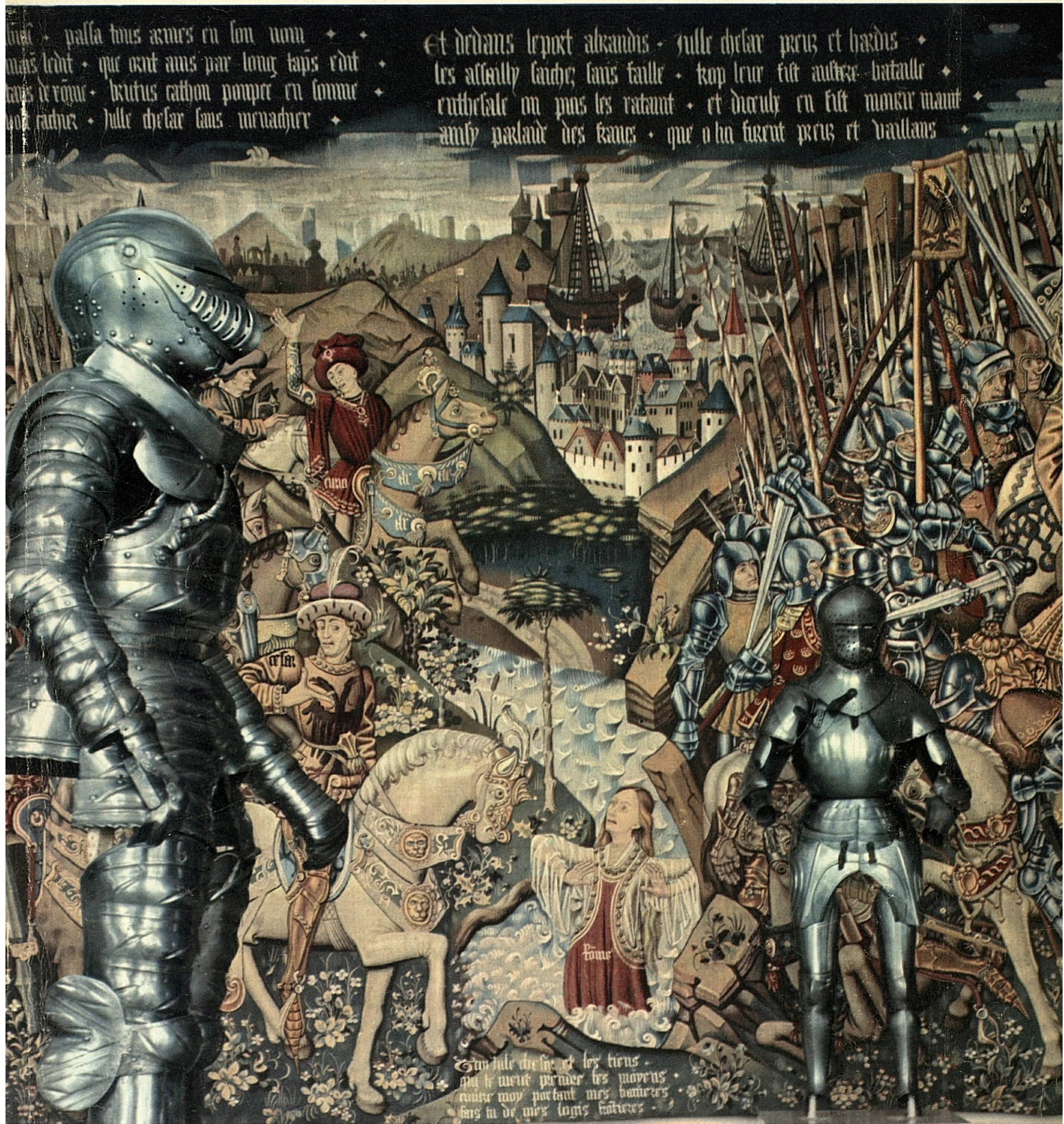
Aus dem Bernischen Historischen Museum: Cäsar am Rubikon. Teilstück eines der vier Cäsartepiche (Tournai um 1470). – Musée historique bernois: César passant le Rubicon. Partie d'un des quatre tapis de César (Tournai 1470 env.).