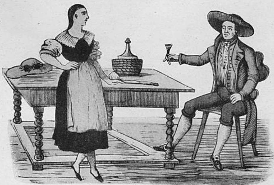
Luzerner Trachten aus der 1841 in Epinal gedruckten Reihe der «Schweizer Kostüme» Costumes lucernoises appartenant à la série des «Costumes suisses» gravée en 1841 à Epinal Costumi lucernesi dalla serie dei «Costumi svizzeri» stampata a Epinal nel 1841 Swiss national costumes of Lucerne, printed in Epinal, France, in 1841

From Carnival until 1 st March a collection of old French popular graphic art will be shown in the Athénée Museum in Geneva, commemorating the work of Charles Pellerin (1756-1836) who lived in Epinal on the Moselle, France, and founded the «Imagerie d'Epinal». These coloured wooden cuts originally used for children's picture books and wall decorations were well known even outside of France and are the predecessors of modern illustrated magazines. Beside these works of art you will also find printing blocks, stencils, brushes, and old catalogues and letters of the period—relics of an age when people had plenty of time for imagination, fun and fable.