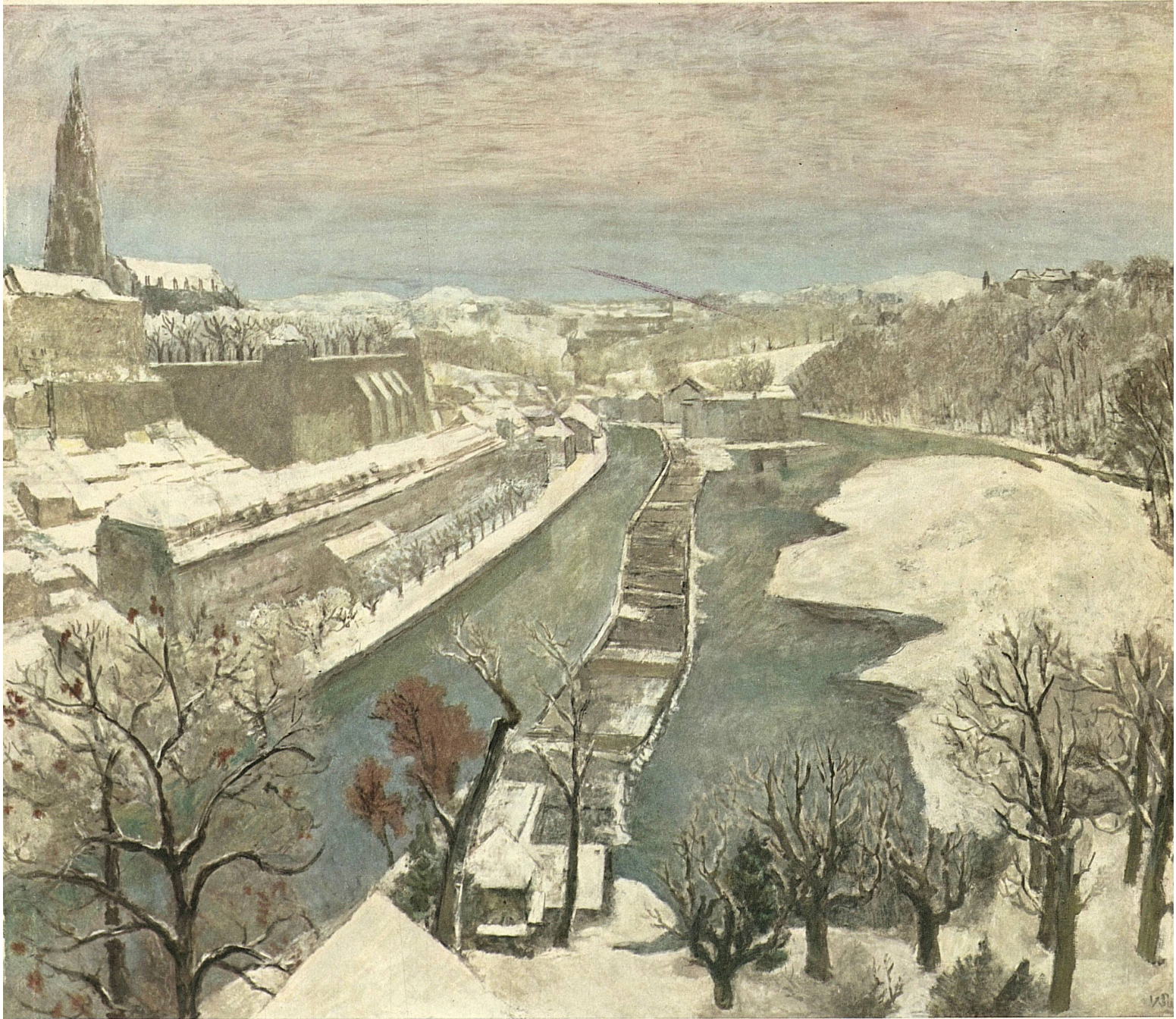
Victor Surbek: Die Berner Altstadt über der Aare im Winter

Editore: Ufficio Nazionale Svizzero del Turismo