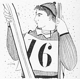
Zeichnung / Dessin: Kurt Wirth

Nous attendons avec impatience les Championnats suisses de ski qui se dérouleront du 1 er au 4 mars sur les magnifiques pentes de Gstaad. Chaque sportif, s'il le peut, s'empresera de coiffer la casquette blanche pour assister personnellement dans la station de l'Oberland bernois à ces importantes compétitions.