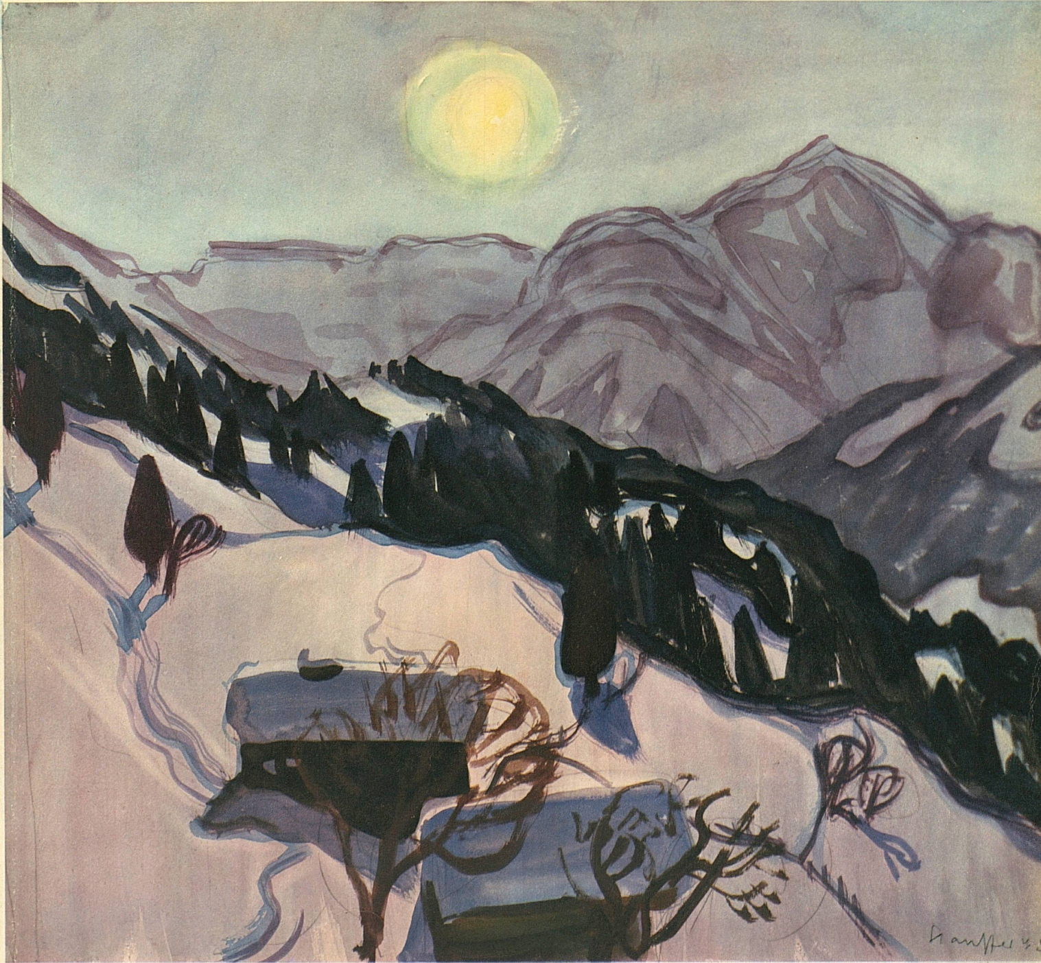
Fred Stauffer: Abendsonne über den Skifeldern von Lauenen bei Gstaad im Berner Oberland Le coucher du soleil illumine les pentes neigeuses de Lauenen près de Gstaad, Oberland bernois Lauenen presso Gstaad nell'Oberland bernese - Lauenen near Gstaad, Bernese Oberland

Herausgeber | Editeur | Editore: Schweizerische Verkehrszentrale Office National Suisse du Tourisme • Ufficio Nazionale Svizzero del Turismo