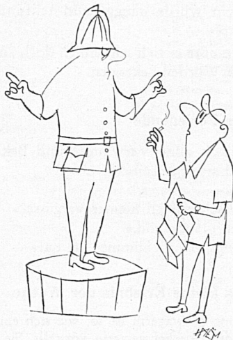
Verkehrspolizisten sind keine Wegweiser

Beweist das nicht, daß die Lehrer auch heute noch Humor haben?