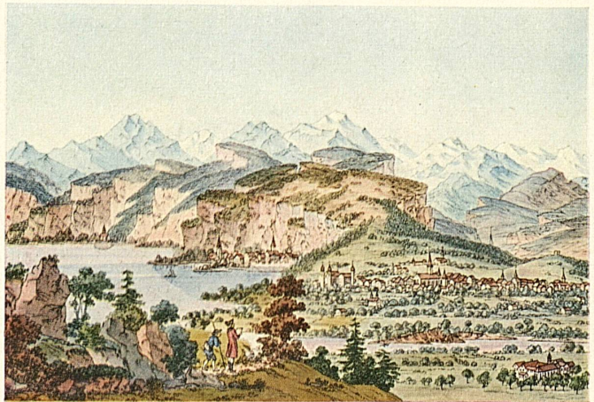
Gabriel Lory, père (1763–1840): Altdorf