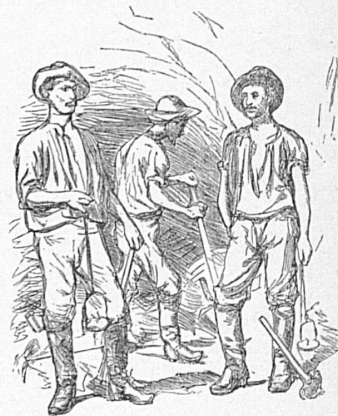
Gruppe von Arbeitern im Tunnel, 1882 Un groupe d'ouvriers dans le tunnel, 1882 Un gruppo d'operai nella galleria, 1882 Grupo de obreros en el túnel, 1882 Group of workmen in the tunnel, 1882