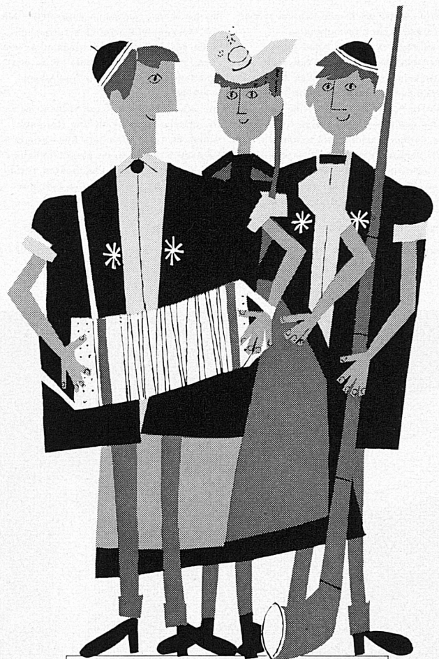
Gesellschaften und Schulen

desco», dal quale bene risulta come le ferrovie concorrano validamente ad assicurare al paese il più indispensabile degli alimenti. Sono esse, infatti, che trasportano i cereali dai porti marittimi e renani ai silos ed ai mulini, e le farine da questi ultimi ai negozi dei fornai. L'esposizione, allestita dal Servizio pubblicitario FFS con la collaborazione dei disegnatori grafici Hugo Wetli ed Hermann Schelbert, e del fotografo Fernand Rausser, occupa quasi per intero il porticato che s'apre sul cortile della Casa dei trasporti.