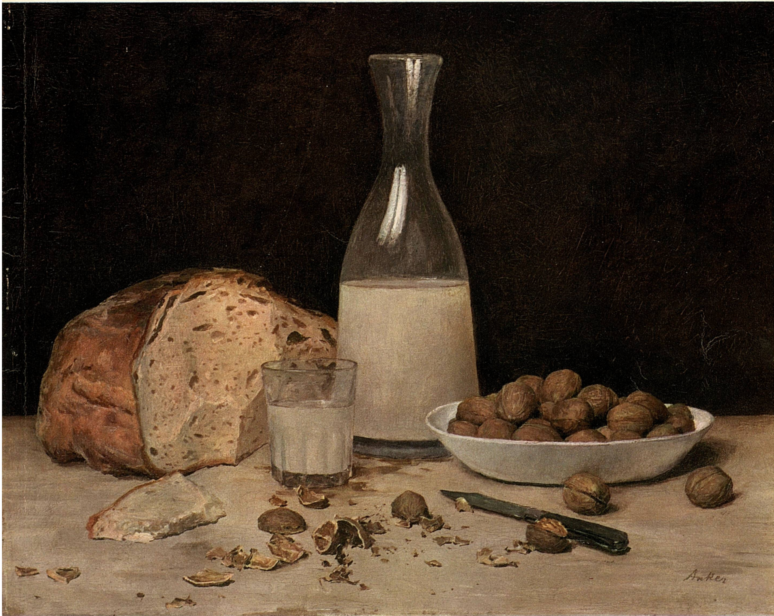
Albert Anker, 1831-1910: Stilleben / Nature morte Privatbesitz Basel